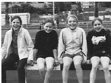
Ja, ja, ihr chönd guät lachä :-)!

Beim Kugelstossen der Juniorinnen und Frauen überzeugten die Einsiedlerinnen nicht ganz. Es stellt sich hier die Frage, ob es wohl an der frühen Morgenstunde oder eher am zierlichen Körperbau der beiden lag!