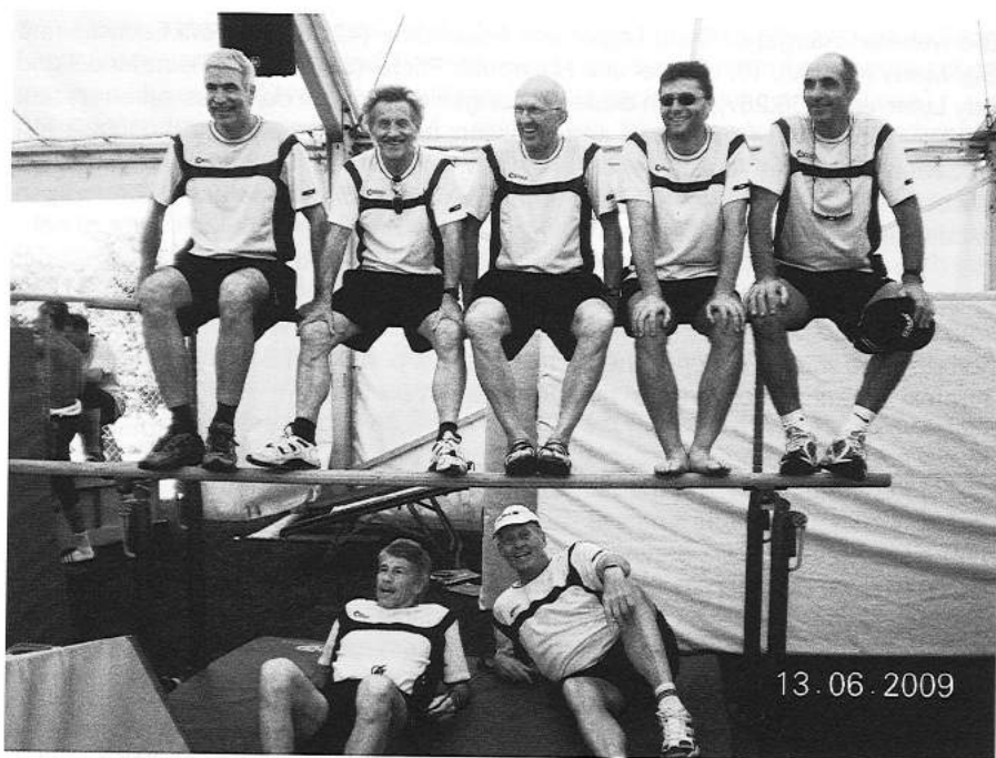
Die Männerturner beim Geniessen der Vorführungen im Gerätezelt