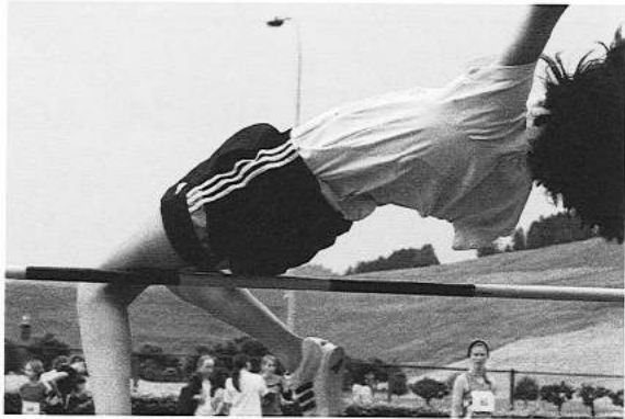
So wie die Grosse...